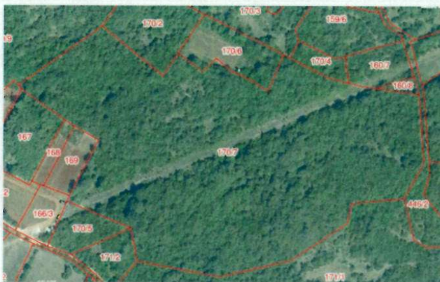
Katastarska čestica prije podjele