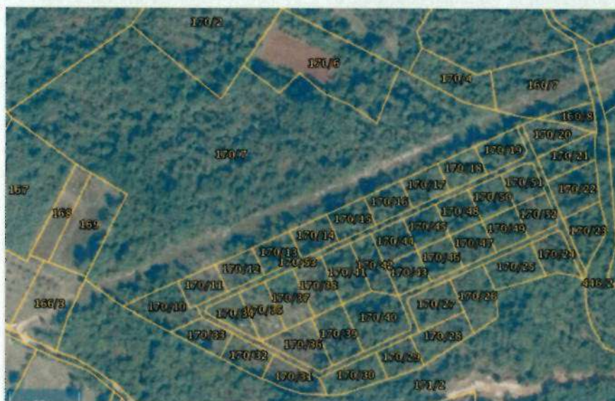
Katastarska čestica nakon podjele

čekalo i duže od šest mjeseci, no oni koji su pristigli vrvjeli su od isprazne kurtoazije – „zahvaljujemo da ste nam skrenuli pažnju na navedenu problematiku“, „u potpunosti podržavamo vašu inicijativu i smatramo kako je neophodno žurno reagirati“, „podupiremo vaše prijedloge za iznalaženjem rješenja“. Zanimljivo je spomenuti da Državna geodetska uprava u svom odgovoru navodi da su sve promjene u katastarskom elaboratu izvršene na temelju pregledanih i potvrđenih geodetskih elaborata koji su izrađeni u skladu sa zakonskim odredbama. Na temelju tih elaborata mijenjan je način uporabe zemljišta iz šume u pašnjak, a veći dio površine je u naravi i dalje šuma, iz čega proizlazi zaključak da je licencirana geodetska tvrtka izradila geodetski elaborat koji ciljano nije bio u potpunosti ispravan, a kojega je odjel za katastar nekretnina proveo kao ispravnog. Već u članku 2. Zakona o šumama stoji Šume i šumska zemljišta dobra su od interesa za Republiku Hrvatsku te