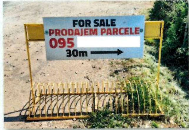
Informacija o prodaji parcela

Svakom onome koji je u stanju sagledati šume i šumska zemljišta s više razine, bez obzira na vlasništvo, ostaje gorka spoznaja izostanka reakcije sustava. Čemu služe prostorni planovi i programi za gospodarenje šumama? U društvu u kojemu su vratolomije sa zemljištem nacionalna disciplina, gdje se nerijetko političari upravo zemljištem bogate na